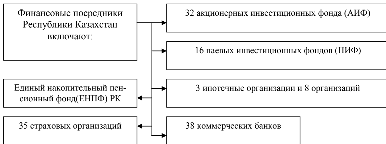
Рисунок 1. Институциональная структура финансового рынка [2, с.176].