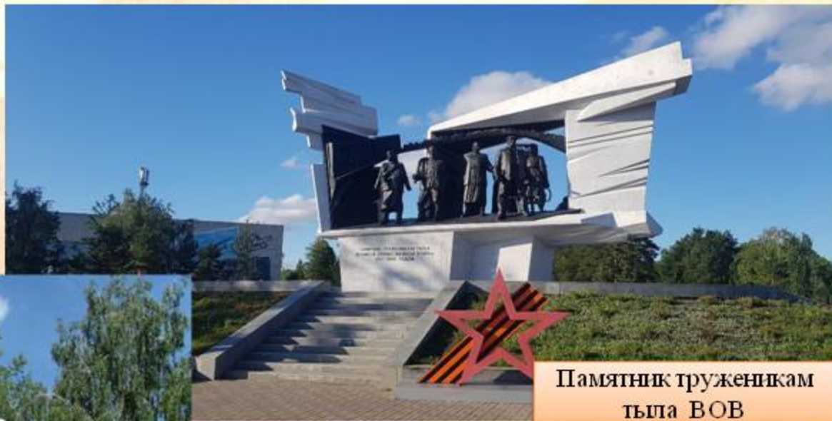
Памятник труженикам тыла ВОВ