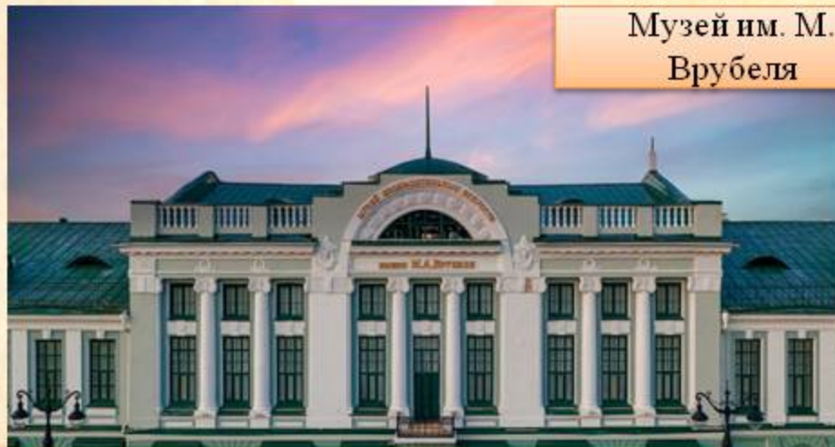
Музей им. М. Врубеля