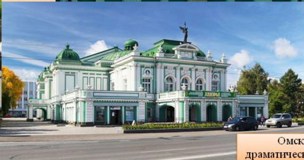
Омский драматический театр