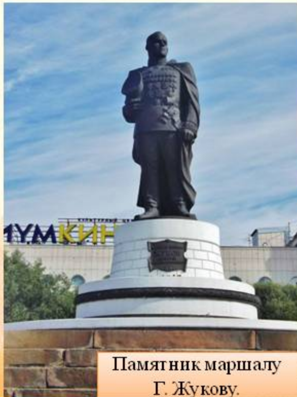
Памятник маршалу Г. Жукову.