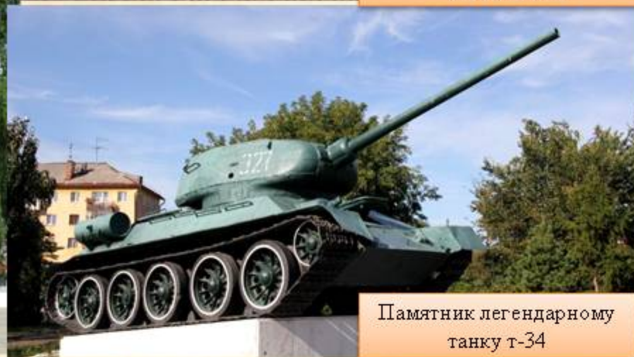
Памятник легендарному танку т-34