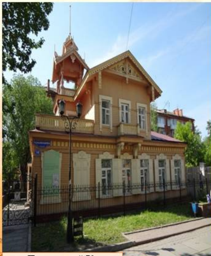
Дом-музей К. Белова

Омск по праву называют культурной столицей Сибири. Старинные здания театров и музеев являются архитектурными памятниками.