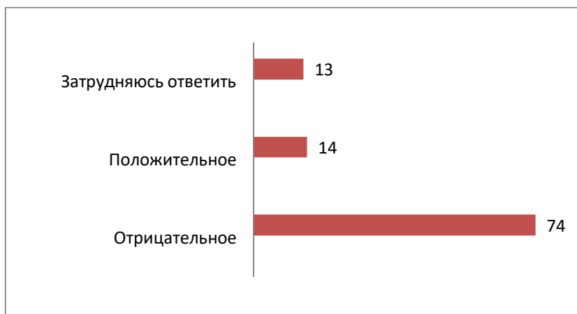
Рисунок 2 – Результаты опроса. Вопрос 2

Следующий вопрос был о том, какое, по мнению населения, отношение к чиновникам, госслужащим преобладает среди россиян: положительное или отрицательное.